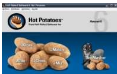
Figura 1. Interface da ferramenta Hot Potatoes.

É uma ferramenta de autoria, criado pelo “Humanities Computing and Media Center” da University of Victoria do Canadá. Esta ferramenta apresenta um conjunto de seis subferramentas para o auxílio à criação de exercícios interativos. São eles: Jquiz, para a criação de questionários de múltipla escolha ou respostas curtas; JMix, produz atividades para ordenação de frases e palavras; JCross, para a criação de palavras cruzadas; Jmath, atividades do tipo arrastar e soltar; JCloze, preenchimento de lacunas e The Master, não disponibilizado na versão livre [4][5]. A Figura 1 apresenta a interface do Hot Potatoes.